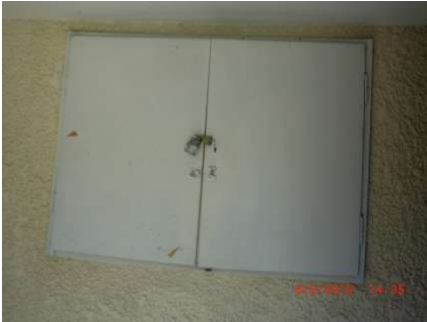
תמונה 2: פינת הלמידה מאחורי לוח החשמל